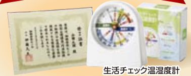
生活チェック温湿度計